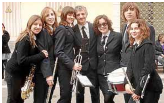
En els darrers mesos la formació musical ha crescut.