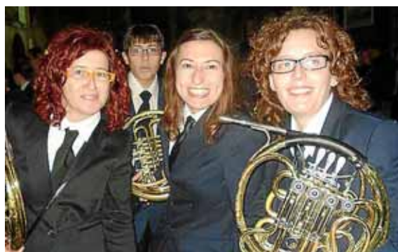
Algunes de les membres de la banda a Porto Cristo.

L'espectacle començarà a les 20.30 hores al teatre Municipal de Manacor i s'espera que seran una “colla de veure”, encara que no tots siguin manacorins. •