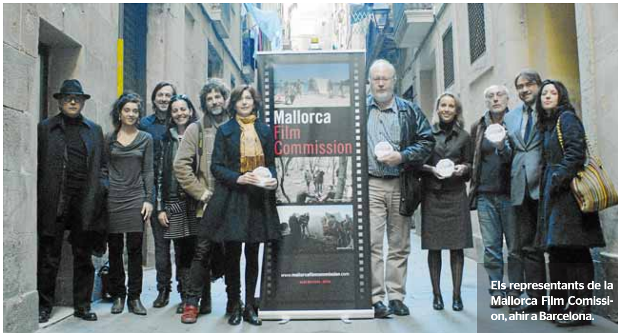
Els representants de la Mallorca Film Commission, ahir a Barcelona.