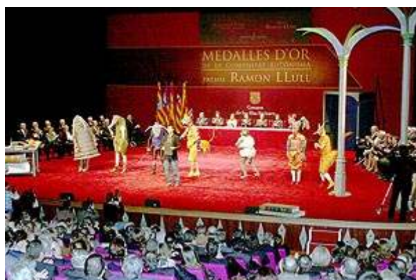
El espectáculo de els Comediants en el acto institucional aportó colorido y realzó la figura de Ramon Llull.