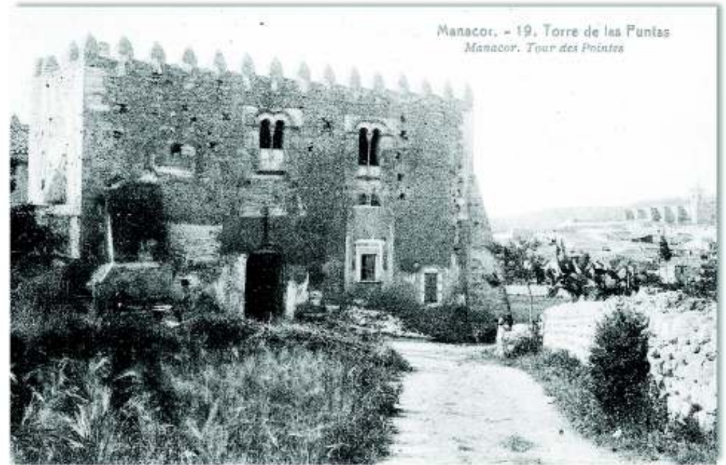
Imatge: Sa Torre, cap al 1910. Col·lecció Joan Riera