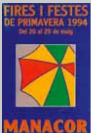
1994 Salvador Grimalt