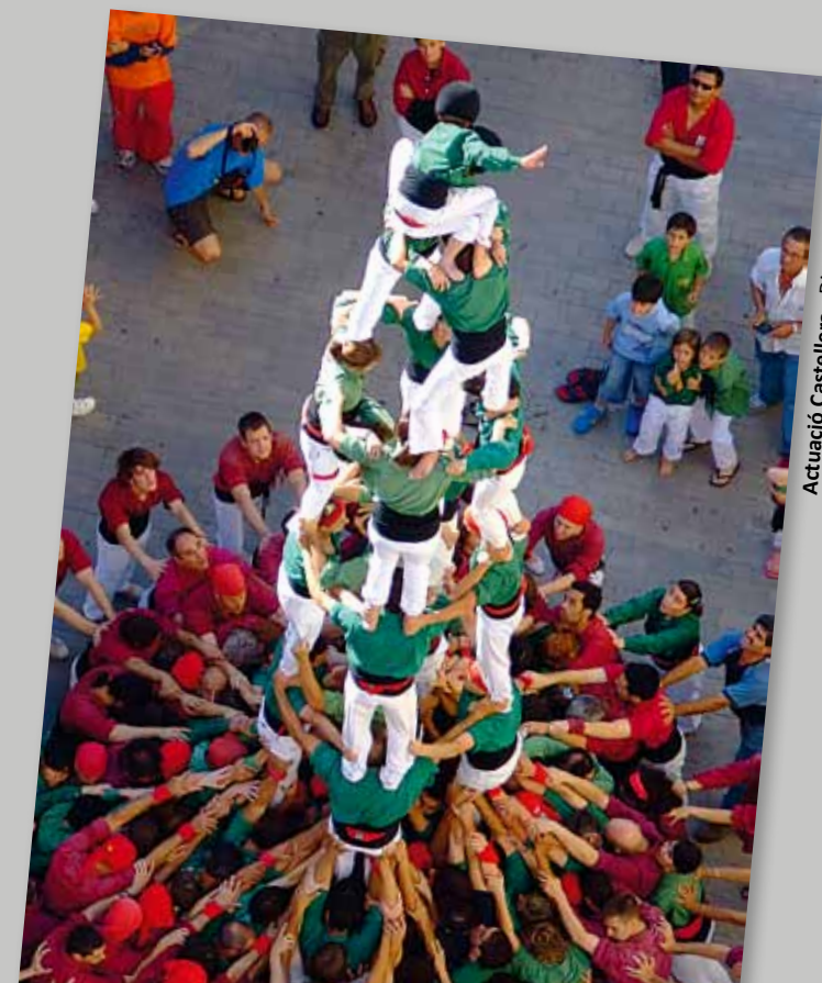
Actuació Castellera - Dissabte 28, a les 18 h