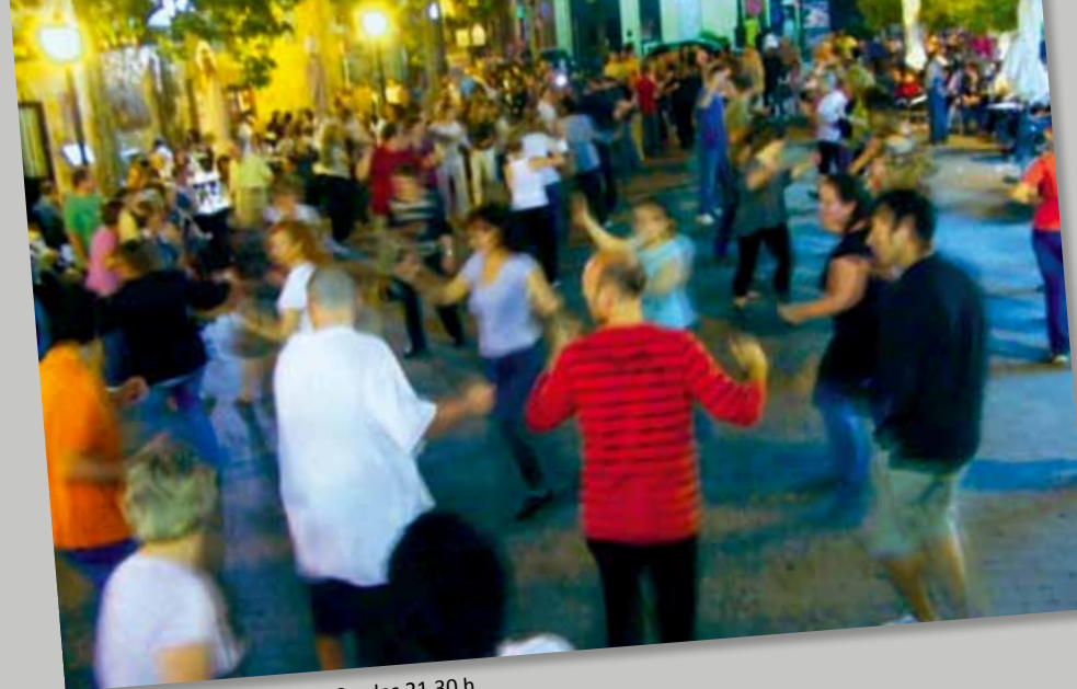
Ballada Popular - Dissabte 28, a les 21.30 h