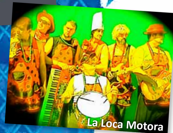
La Loca Motora