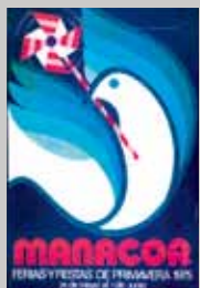
1975 Julio Arruga