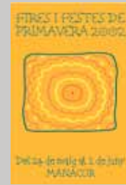
2002 Catalina Font