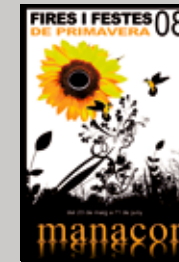
2008 Felip Toni