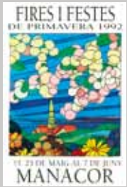
1992 Paul Woodthorpe