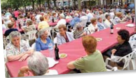
Trobadra de gent gran

Per Albert Carvajal Lloc: Museu d'Història de Manacor Conferència associada a l'exposició «D'Olímpia a Manacor. Breu repàs per l'esport»