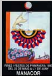
1997 Martí Busquets