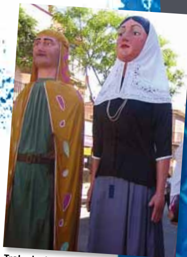
Trobada de Gegants Dissabte 4, a les 17 h