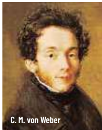
C. M. von Weber

Divendres 14 de març - 19.30 h Auditori de Manacor - 20 €