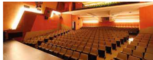
Teatre de Manacor