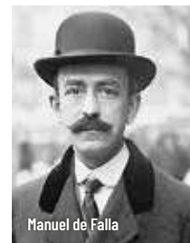
Manuel de Falla