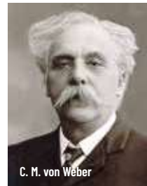
C. M. von Weber

Divendres 24 de gener - 19.30 h Auditori de Manacor - 20 €