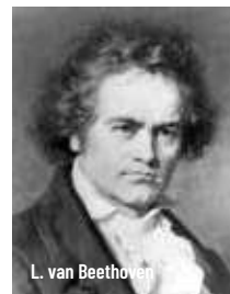
L. van Beethoven

Divendres 21 de febrer - 19.30 h Auditori de Manacor - 20 €