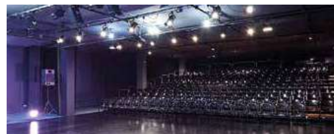
Teatre de Manacor