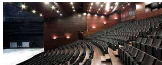
Auditori de Manacor

Les portes s'obriran 30 minuts abans de l'inici de cada funció. Aconsellam al públic que entri entre els 30 i els 10 minuts abans de l'inici de la funció. D'aquesta manera evitarem aglomeracions i es podrà començar en punt.