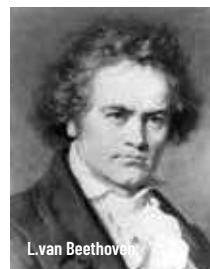
L. van Beethoven

Divendres 2 de gener - 19.30 h Auditori de Manacor - 25 €