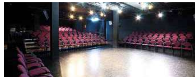
Teatre de Manacor