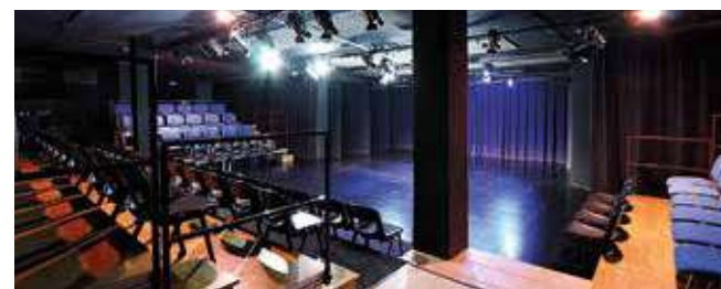
Teatre de Manacor