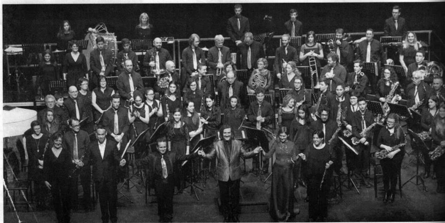
Tot el públic, dret pel gran concert