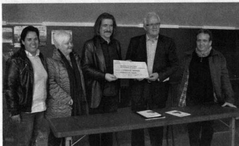
Luis Cobos, entregant el xec en favor de la Fundació Trobada, i les dones de la Banda, fotografiant-se amb ell